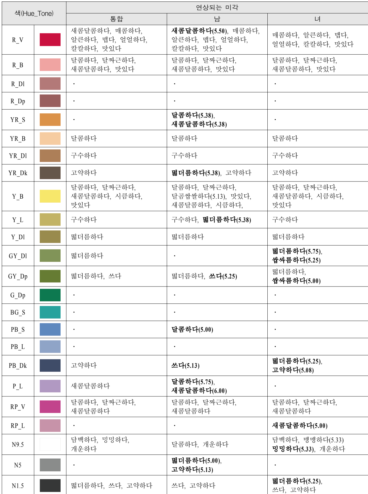
표 5. 색상별 연상되는 미각 형용사 6)